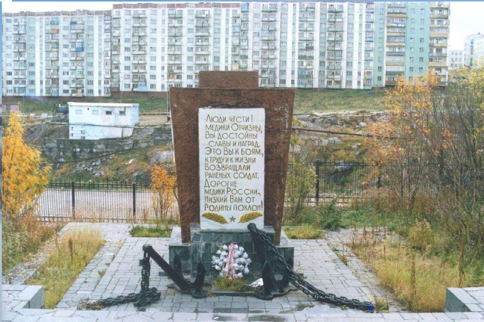
Памятник военным медикам