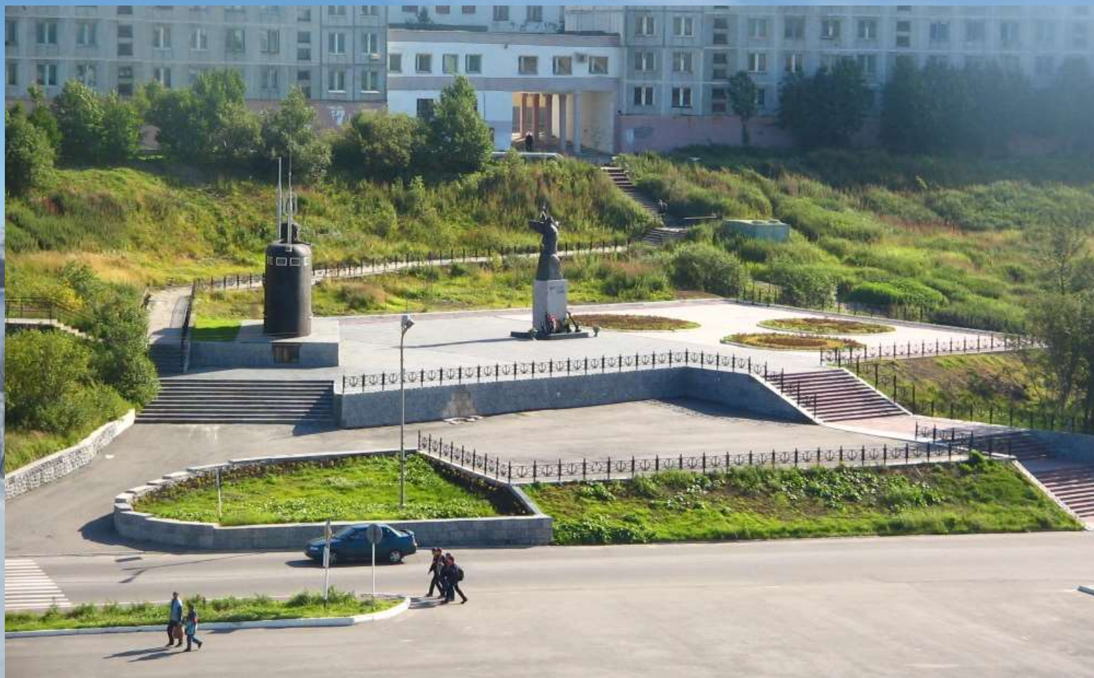
Мемориальный комплекс «Морская душа»