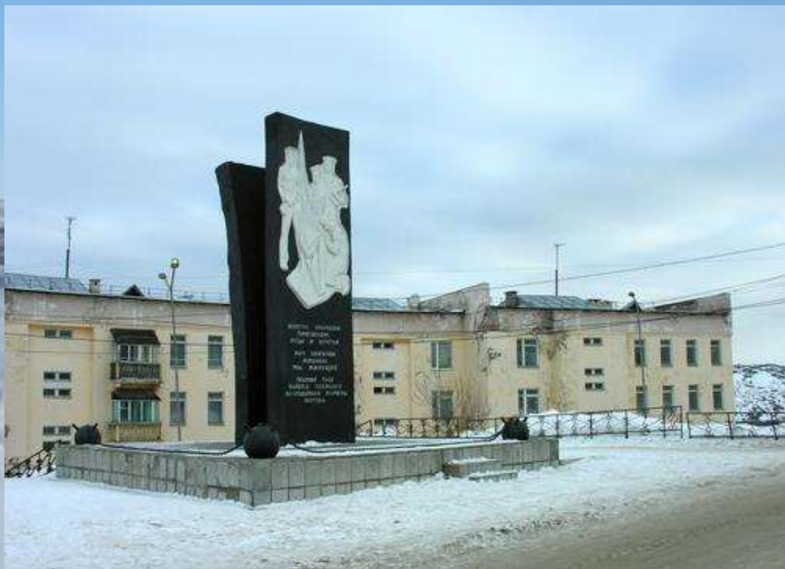
Памятник морякам ОВРа (охраны водного района).